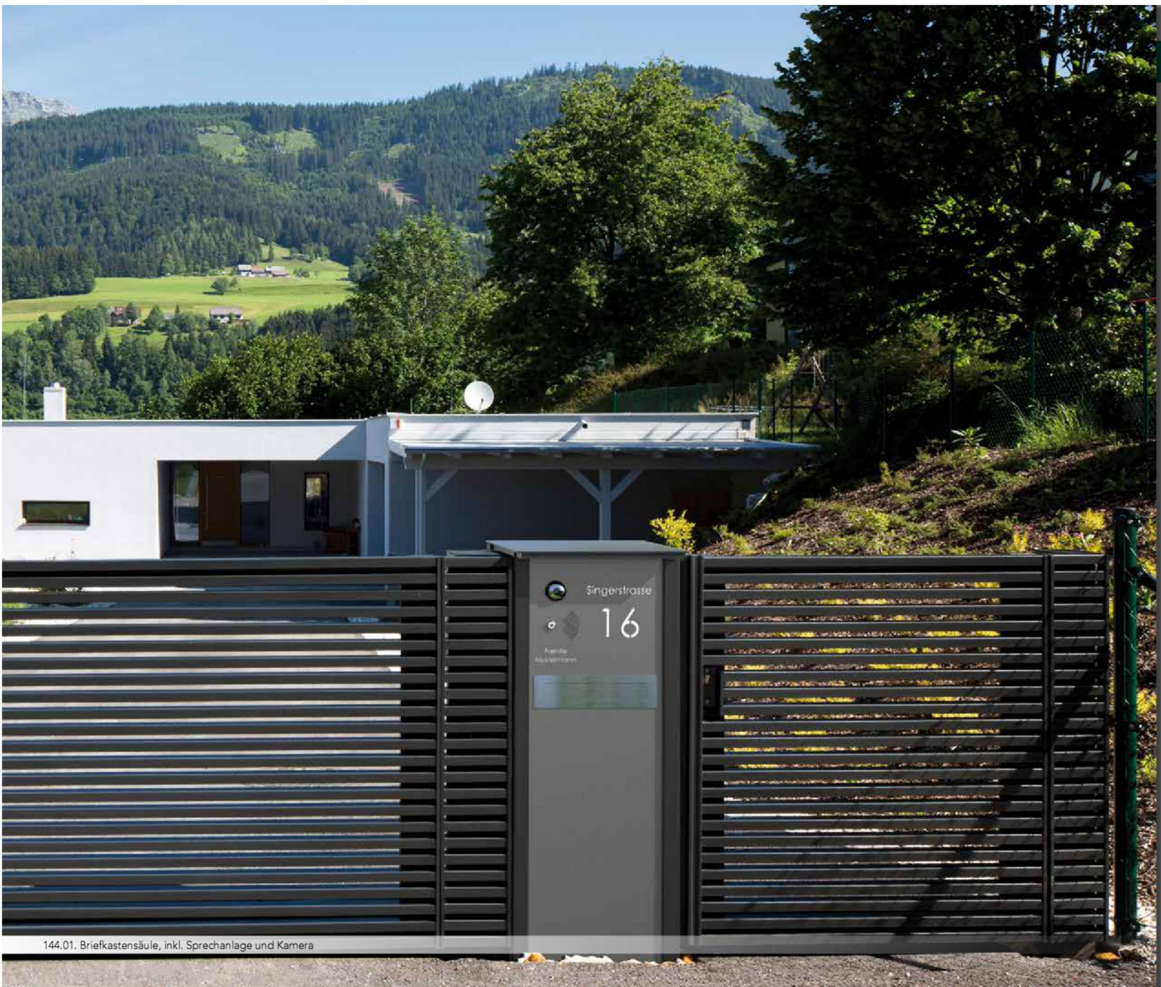
144.01. Briefkastensäule, inkl. Sprechanlage und Kamera