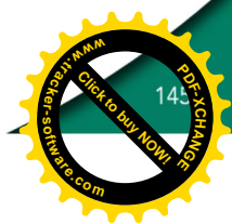
147.01. Briefkastensäule, Briefschlitz aus Edelstahl