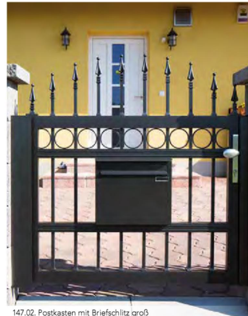
147.02. Postkasten mit Briefschlitz groß

Briefkastensäule schmal: Breite 400 mm, Tiefe 120 mm, Höhe variabel