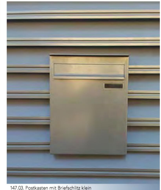
147.03. Postkasten mit Briefschlitz klein